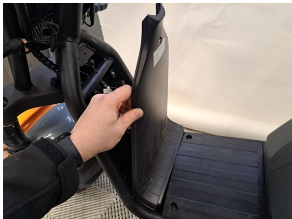
Otan rungon etuosan takakate pois.