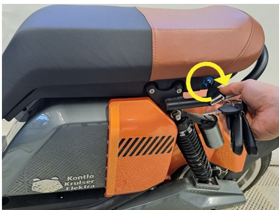
Avaa penkin lukitus avaimella.