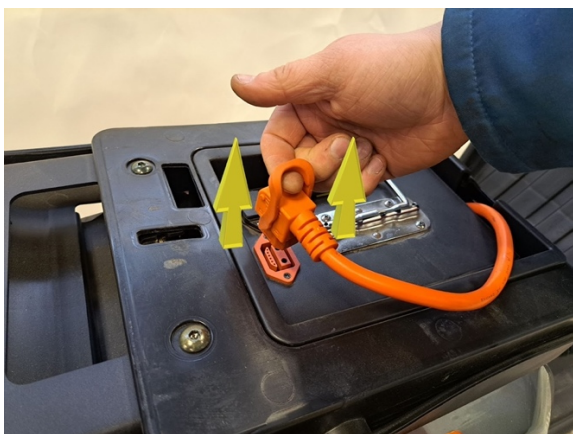
Irrota akun pistoke akusta.